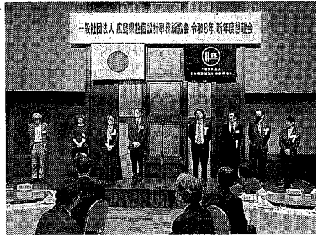
新役員紹介のようす